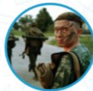
Юный спецназ Росгвардии