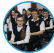
Юные помощники полиции