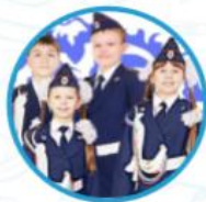
Юные инспектора движения